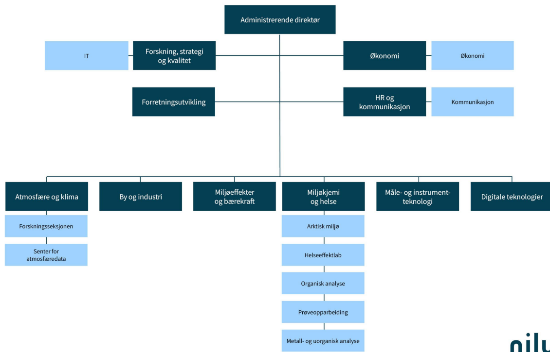
Figur 1: NILUs organisasjonskart.

kvalitet, HR- og kommunikasjonsdirektør, direktør for forretningsutvikling og økonomidirektør. En oversikt over NILUs organisasjon er gitt i figur 1.